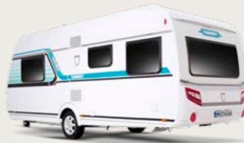
Design variant MINT