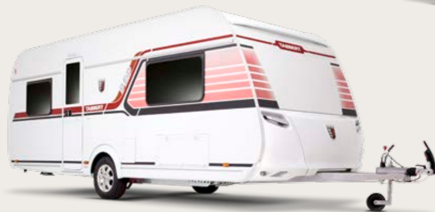
Design variant RED